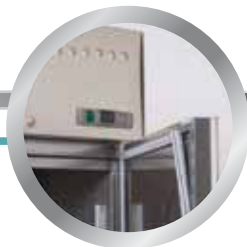
Uitneembaar deurrubber replaceable door gasket