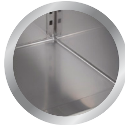
afgeronde hoeken rounded corners

SPECIFICATIES: Volledig AISI 304 RVS Scotchbrite gepolijst Volledig automatisch Isolatie 100% CFC vrij -70 mm Omkeerbare deur Zelfsluitende deur Elektronisch gestuurd Koeling middels ventilator Uitneembaar deurrubber Poten in hoogte verstelbaar Slot Afegronde hoeken (hygiëne) Omgevingstemperatuur +43 °C