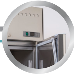
uitneembaar deurrubber replaceable door gasket