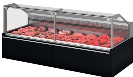
PATMOS 2.0 1250 M1

De Nordcap verawarenbuffetten zijn conventionele koeltoonbanken voor het tentoonstellen en verkopen van vlees(waren), zuivelproducten, kaasproducten en delicatessen.