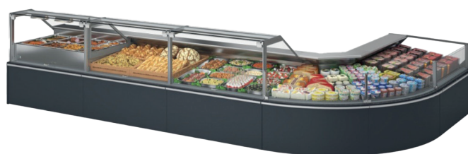
MILOS 2.0 AC45°-O M2